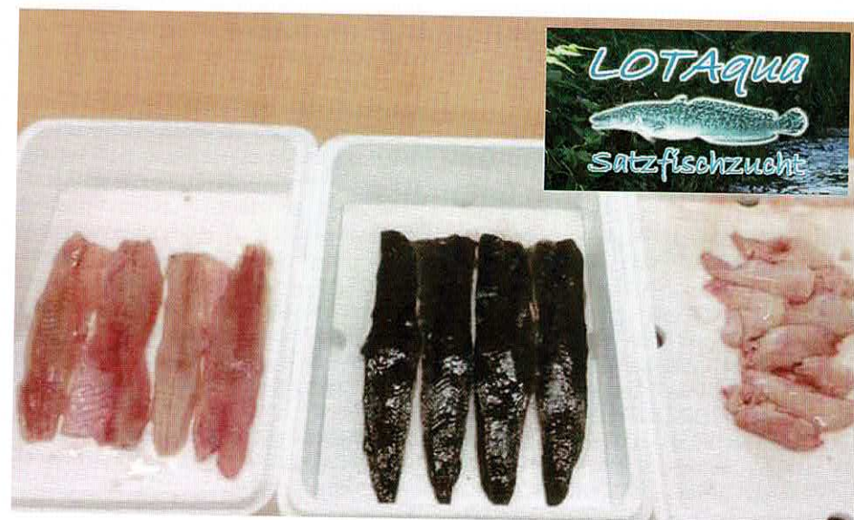
Filets (links), filets op vel (midden) en levers (rechts) van gekweekte zoetwaterkabeljauw

rond de zoetwaterkabeljauw waarbij, naast onze eigen ervaringen, ook twee internationale sprekers enkele technische en economische aspecten van de teelt in hun land kwamen toelichten. Aan de studiedag deden 32 deelnemers mee. Om het publiek direct kennis te laten maken met de zoetwaterkabeljauw, mocht Johan