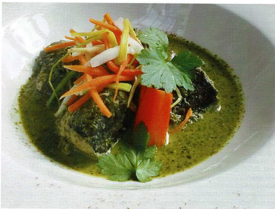
Zoetwaterkabeljauw geserveerd "in het groen" in het restaurant 'Fief De Liboichant'

zoetwaterkabeljauw op 16°C wilt houden. Uit Fridolin's berekeningen zou de kweek van 10 gr tot 541 gr ongeveer 450 dagen duren. De lage voederconversie (1.01) en lage energiekosten door het gebruik van bergwater maken de kweek economisch aantrekkelijk. Toch blijkt uit zijn presentatie dat verwerkingskosten (voornamelijk bij het fileren) het kostenplaatje behoorlijk verhogen.